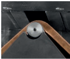
Biegen SH 401PLC-E