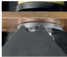
Lochen SH 403, SH 404, SH 409