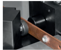
Einpressen von Muttern SH 407