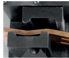
Etagenbiegen SH 406PLC